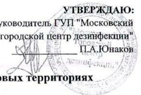
ГРАФИК проведения дератизационных мероприятий в многоквартирных домах и на дворовых территориях г. Москвы в 2019 году (к Договору №24-ДЖКХ/19 от 16.01.2019г.)